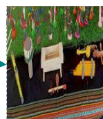
Sản phẩm của búp bê và nhạc cụ