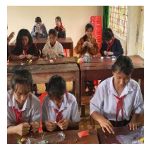
Làm búp bê và nhạc cụ