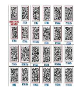
Nghiên cứu tài liệu; tạo mã QR