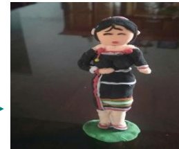
Thử nghiệm búp bê lần 2, 3, 4