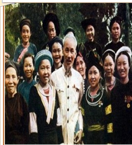
Bác Hồ với dân tộc thiểu số (Ảnh tư liệu)